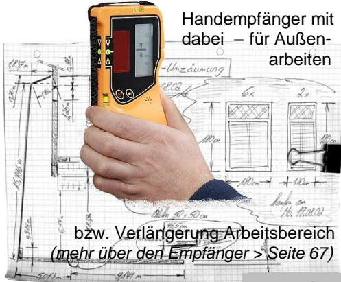
Handempfänger mit dabei – für Außenarbeiten

bzw. Verlängerung Arbeitsbereich (mehr über den Empfänger > Seite 67)