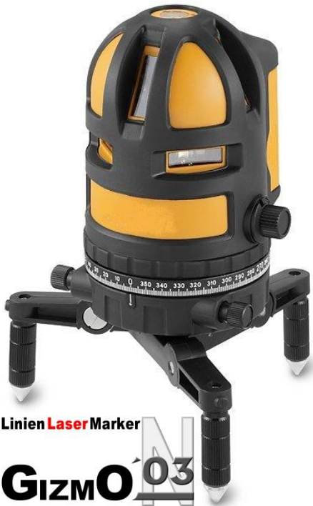
Linien Laser Marker