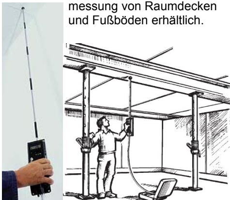
Erweiterungs- H-Set zu nivcomp